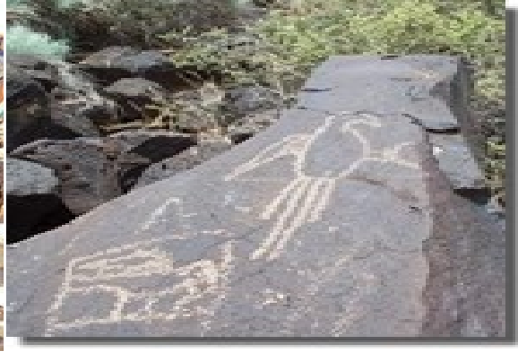
Marca di Indjian

E cueba di calichi yama Quadirikiri ta un di e cuebanan special den Parke Nacional. E ta un cueba notabel pa su kamber cu un forma di mita luna cu ta ser ilumina pa solo door di e buraconan den e plafon. Entrada pa e cueba ta na e cuminsamento di e sero. E cueba aki di 492 pia (150 meter) largo ta un luga y neishi pa hopi raton di anochi chikito y natural, cu no ta peligroso. Pa preserva e bruimento di e habitat natural pa e ratonnan aki, un di cuebanan, Huliba, ta sera pa bishitantenan.